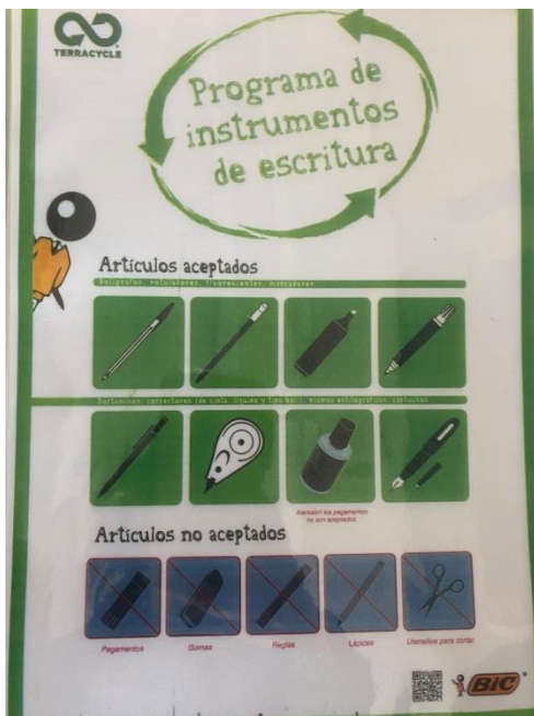
Recogida de útiles de escritura