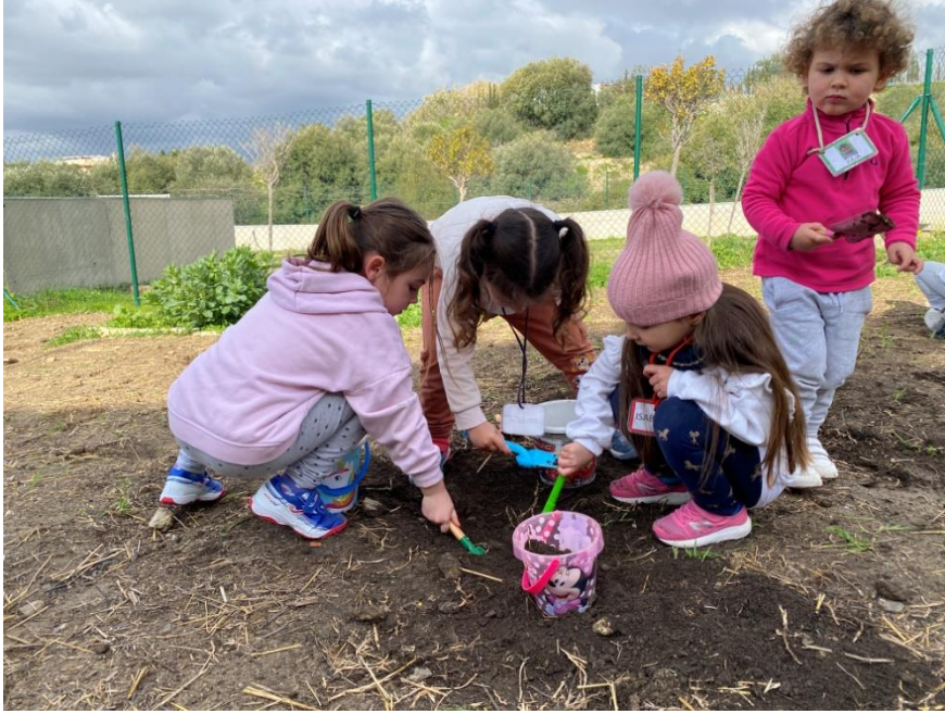
Acondicionamiento del terreno.